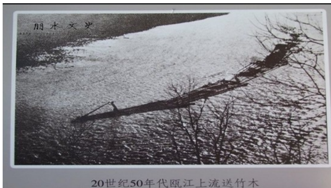
20世纪五十年代瓯江上流送竹木