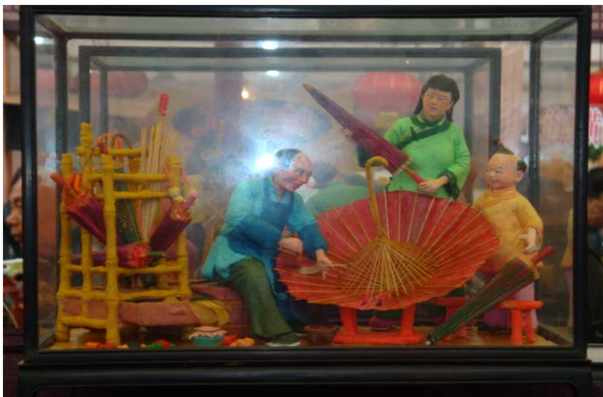
温州百工 摄于拦街福活动 2009 年 4 月