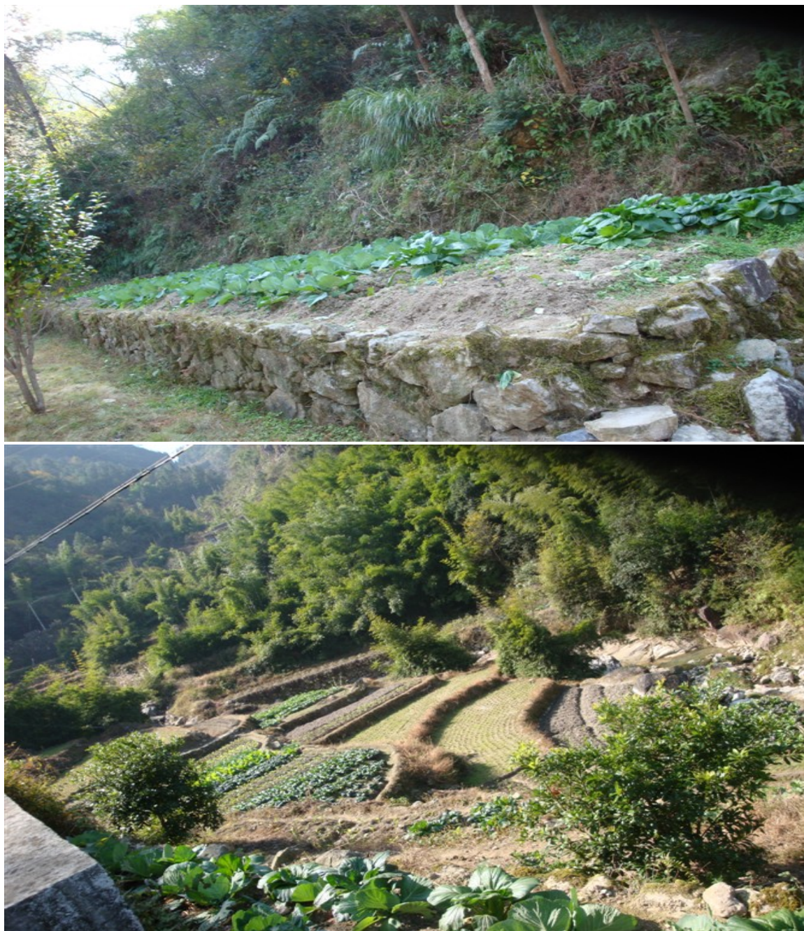
土薄难艺 2009年10月摄于泽雅乡间