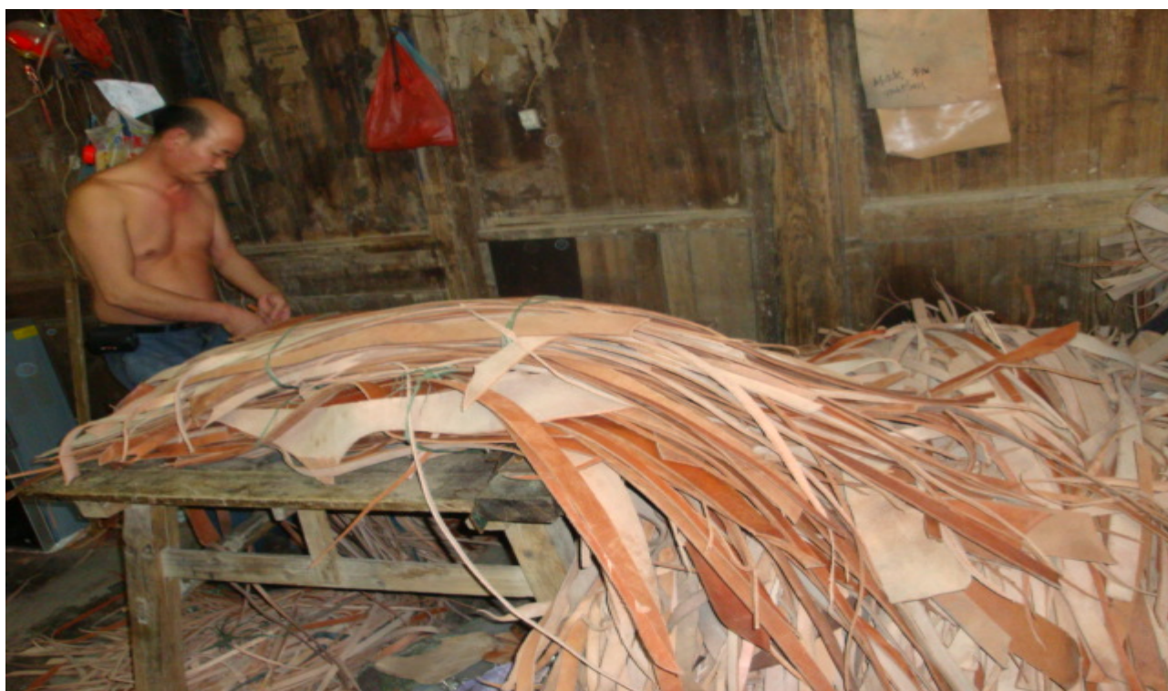
在手工作坊加工皮革的工人师傅 摄于平阳水头 2009 年 10 月