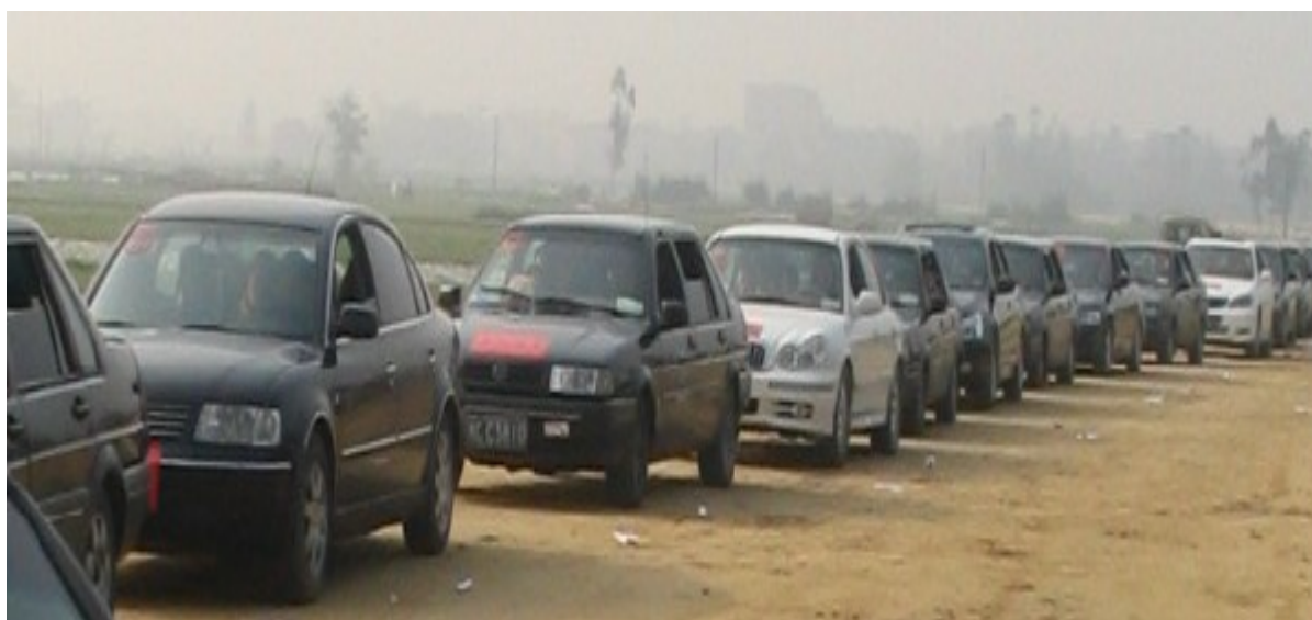
清明上坟祭祖盛况