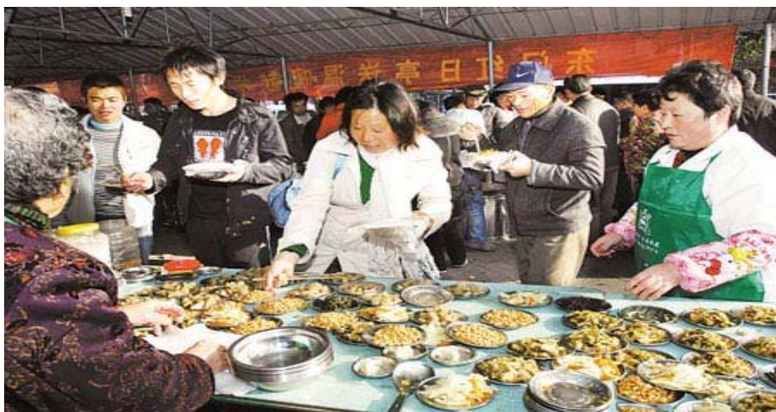
在红日亭施粥摊, 2008年12月