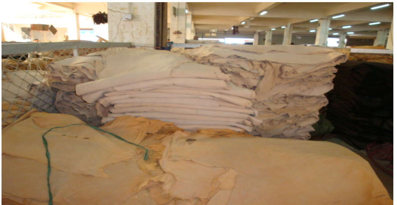
市场内部成堆的皮革