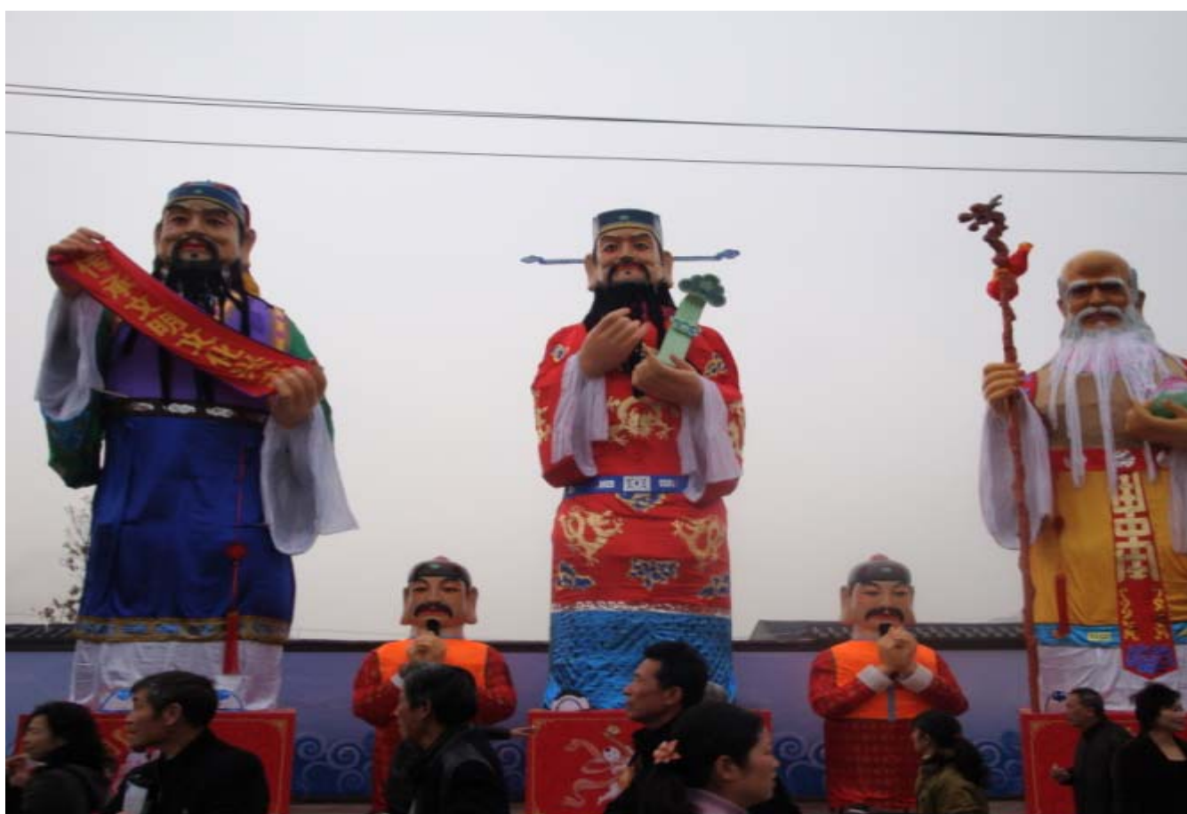
温州民间大型拦街福活动 摄于 2009 年 4 月