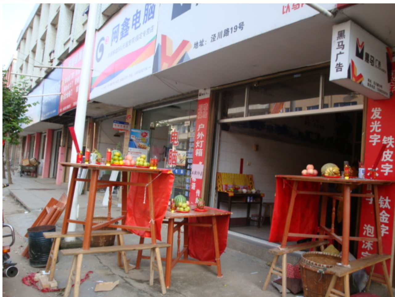
民间街头信祀 摄于平阳水头 2009年10月