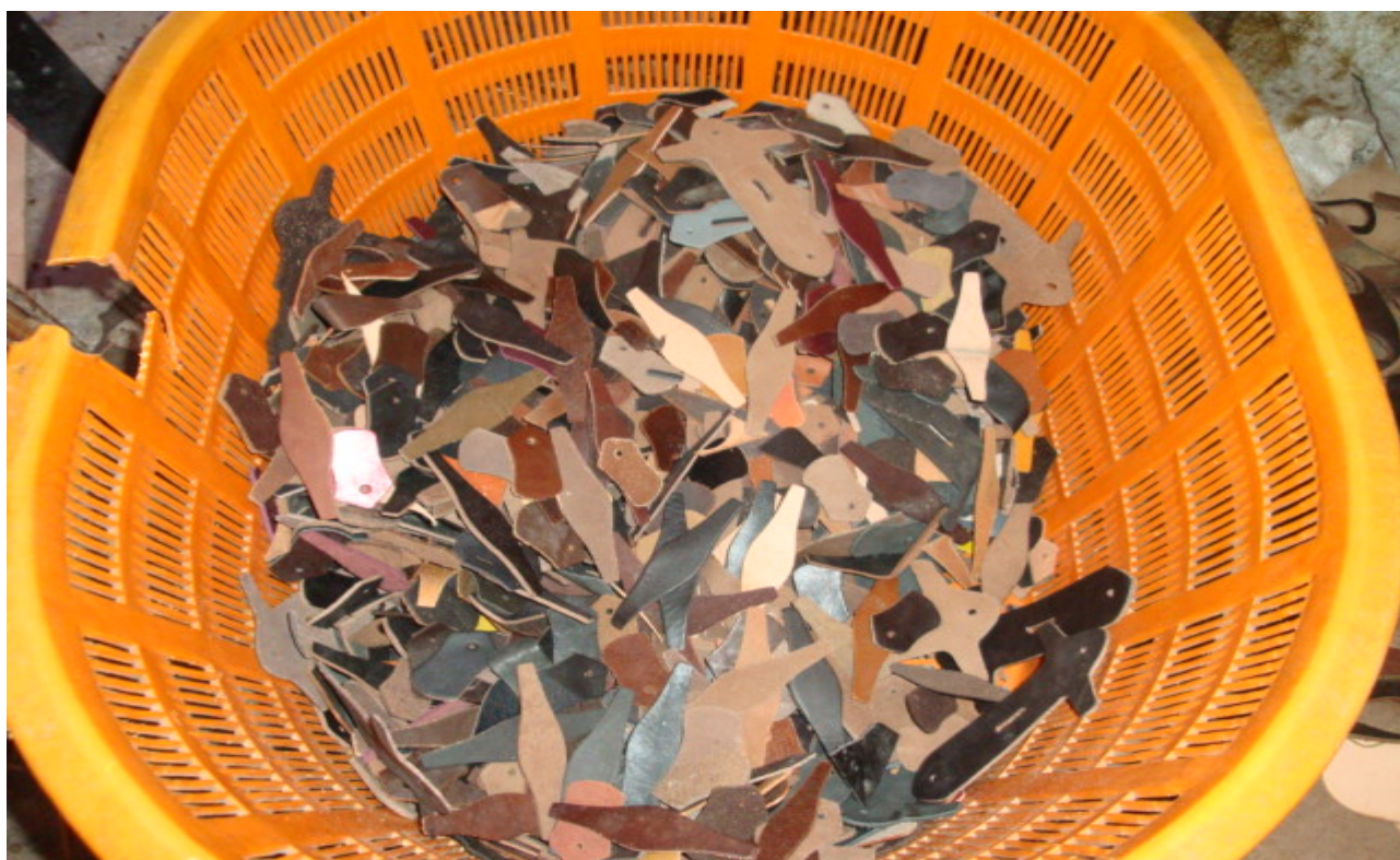
加工完成的皮革成品 摄于平阳水头 2009 年 10 月