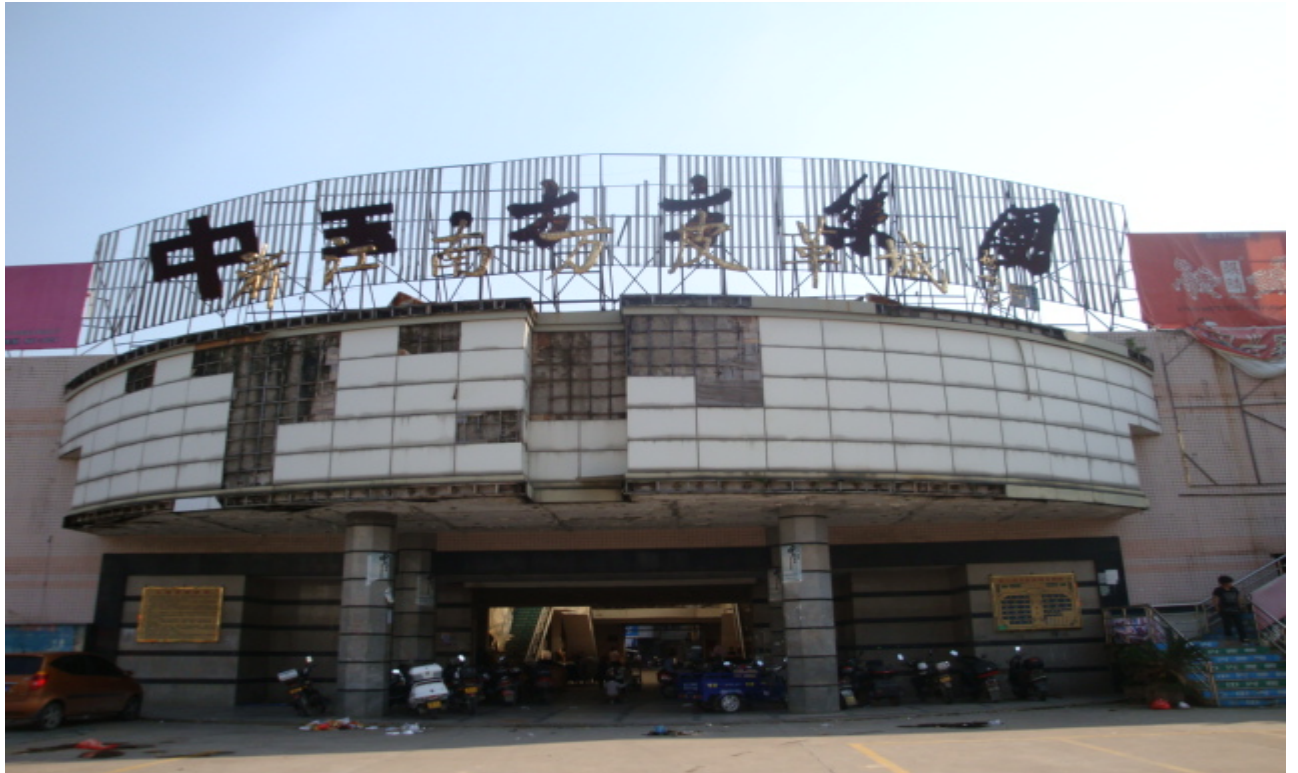
水头皮革专业市场