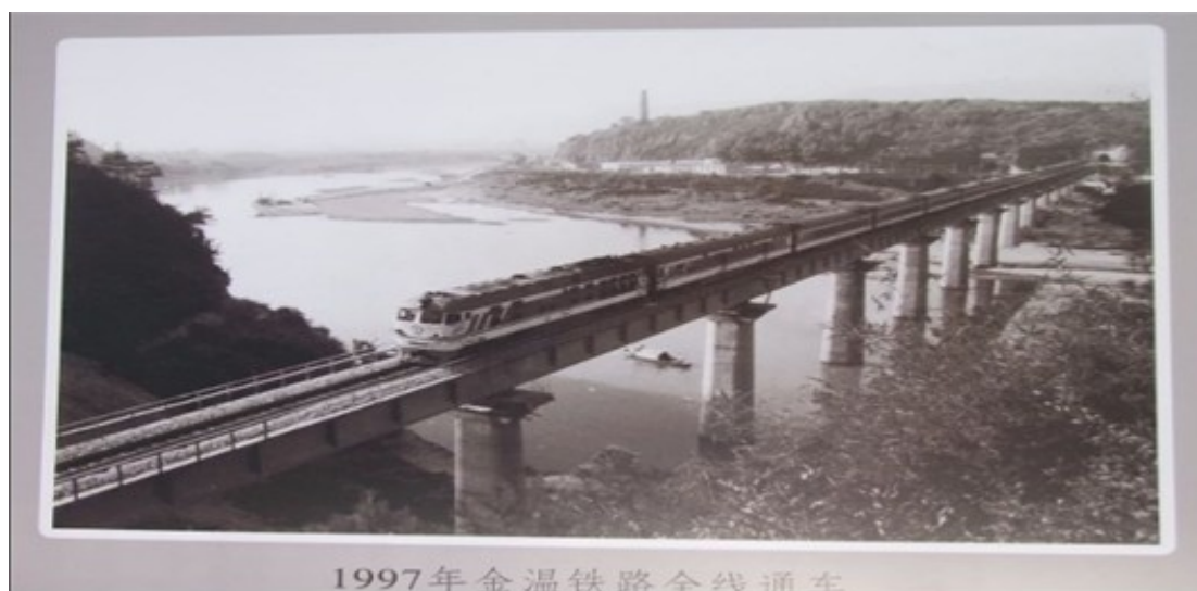
1997年金温铁路全线通车